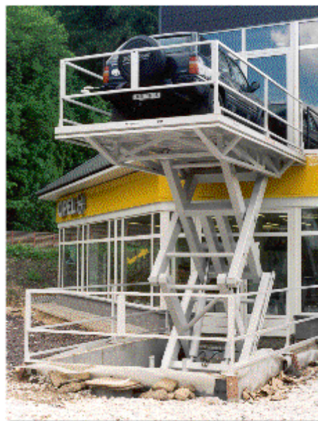
jako nákladní výtah