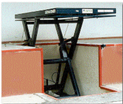
jako vyrovnávací rampa